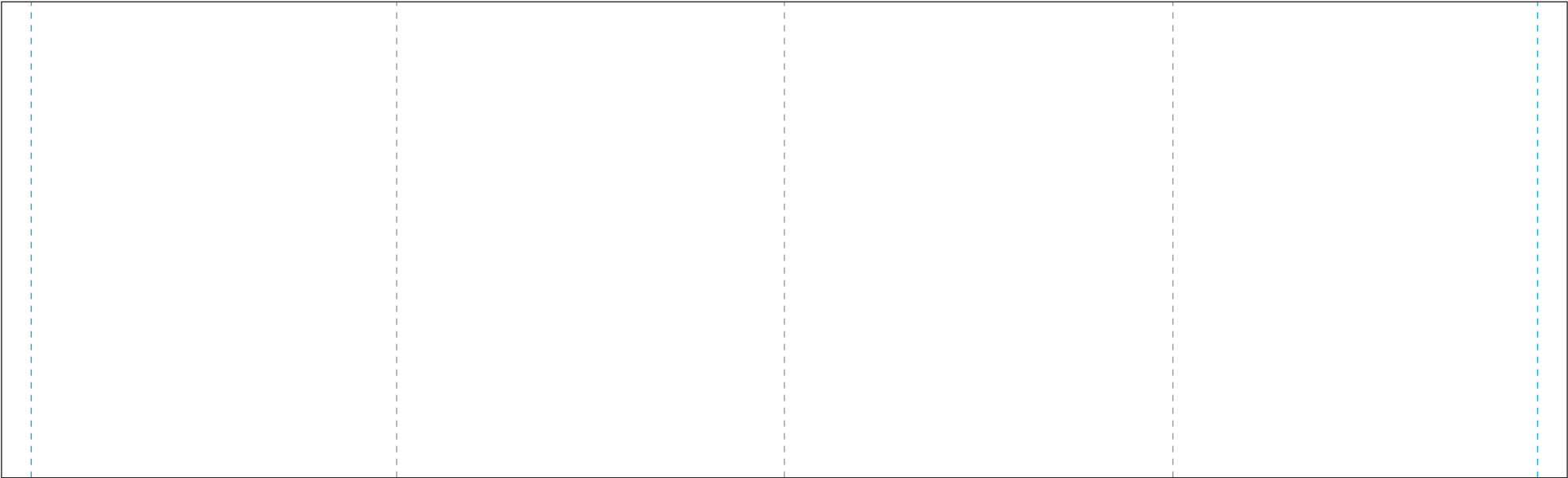
Druckfläche/print area Schnittkante/cutting edge