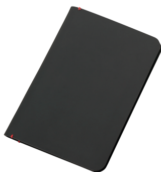
Abbildung oben 1:1

Reisepasshülle und Kreditkartenetui, 2 große Einsteckfächer für z. B. Reisepass, Boardingpass und Geldscheine, 3 Kartenfächer mit Ausleseschutz (für RFID Chips), Etui nahtlos verschweißt, Oberfläche antibakteriell, Kunstleder, rot/schwarz